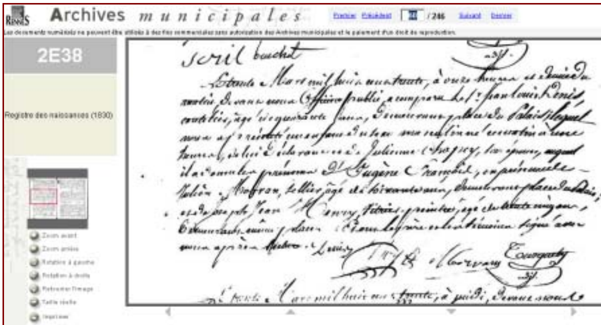
Fonction Zoom appliquée à une sélection